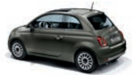
372 Colosseo Grau