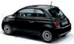
876 Vesuvio Schwarz