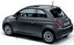
695 Pompei Grau