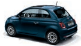
687 Dipinto di blu Blau