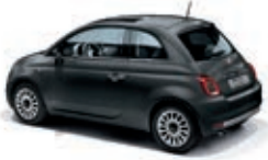
735 Carrara Grau