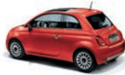
552 Corallo Rot