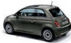
372 Colosseo Grau