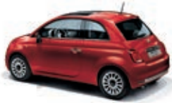
111 Passione Rot