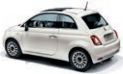
268 Gelato Weiss