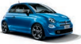
425 Italia Blau