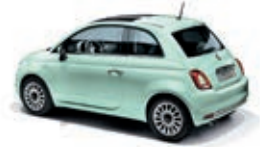
166 Lattementa Grün