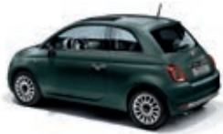
421 Grün Portofino Matt